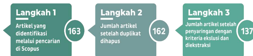
Gambar 2. Proses seleksi artikel

Analisis data dilakukan terhadap artikel yang disaring menggunakan kueri yang sudah disusun. Dan dibatasi antara tahun 2014 hingga Juni 2024. Penarikan data dilakukan pada tanggal 22 Juni 2024, dengan total 163 data yang berhasil diambil. Setelah menghapus 1 data yang terduplikasi dan menerapkan kriteria eksklusi, tersisa 137 artikel. Meskipun penelitian ini tidak bertujuan untuk melakukan analisis bibliometrik, beberapa informasi tetap disajikan karena menarik.