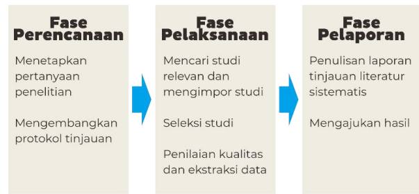
Gambar 1. Fase Proses Tinjauan Literatur

Protokol yang digunakan dalam melakukan tinjauan literatur mengikuti panduan Kitchenham dan Charters (2007). Protokol ini mencakup tiga fase dalam proses tinjauan literatur, yaitu fase perencanaan, fase pelaksanaan, dan fase pelaporan.