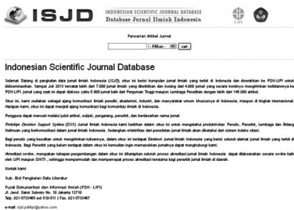
Gambar 2: Database ISJD PDII-LIPI

jurnal online yang efektif diperlukan enam kriteria, yaitu tersedianya fitur artikel terbaca, tersedianya fitur tumpah dan cetak artikel terbaca, kekinian jurnal yang tersedia, tersedianya fitur search dan retrieval , serta kemudahan mengakses dan terhubung kepada jurnal lain. Database ISJD dibangun oleh PDII-LIPI sejak Tahun 2009, dengan konten informasi sejumlah 70.000 artikel dan 3.656 jurnal ilmiah (Tambunan, 2012).