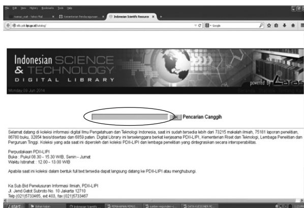
Gambar 3. Menu Pencarian Umum di Katalog LARAS

Di bawah ini contoh tampilan sistem penelusuran informasi menggunakan menu pencarian umum dan pencarian canggih pada katalog LARAS PDII.