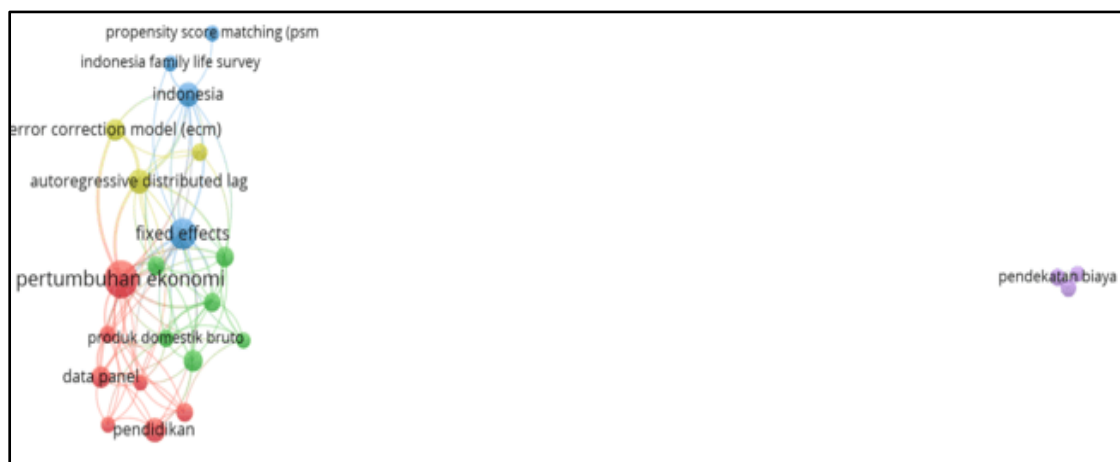
Gambar 2. Visualisasi Pemetaan Topik Tugas Akhir Mahasiswa Departemen Ilmu Ekonomi

Pengelompokan atau pengklasteran dari kata kunci dengan minimal co-occurrence lima. Peneliti menggunakan minimal co-occurrence lima karena item-item pada klaster dan kata kunci sudah cukup untuk mewakili analisis dari topik-topik penelitian tugas akhir mahasiswa Departemen Ilmu Ekonomi secara makro. Pengklasteran topik penelitian tugas akhir mahasiswa Departemen Ilmu Ekonomi yang diwakili oleh kata kunci berjumlah 5 klaster dapat divisualisasikan pemetaannya pada Gambar 2.