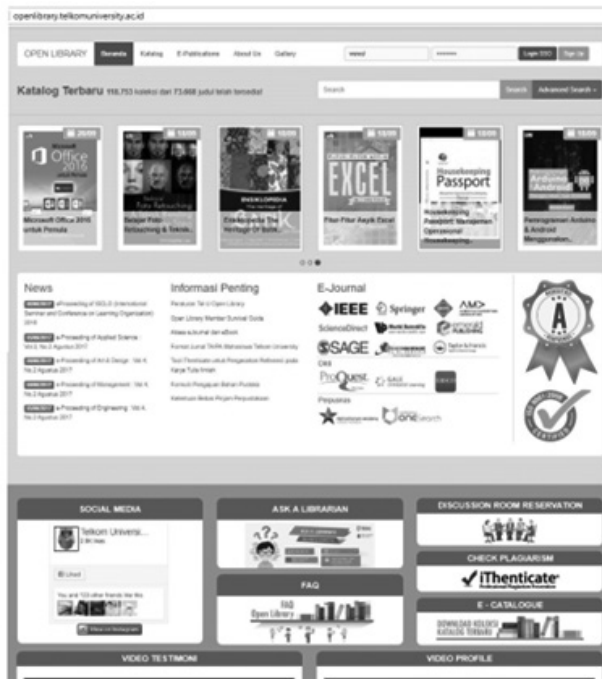
Gambar 3: openlibrary.telkomuniversity.ac.id

Telkom University Open Library tidak hanya memberikan perhatian dan menyediakan akses secara online kepada masyarakat pengguna, untuk kegiatan pengembangan pengetahuan dan komunitas Tel-U Open Library memfasilitasi area dan saran yang dapat digunakan oleh masyarakat umum. Open Discussion adalah program pengembangan pengetahuan dan kegiatan komunitas yang diselenggarakan