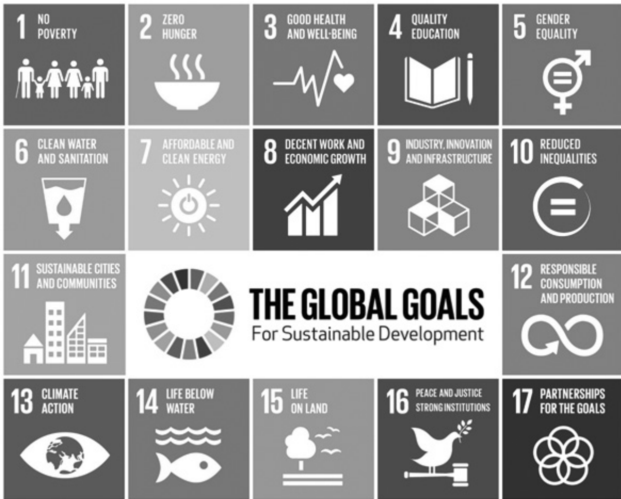
Gambar 1: Sustainable Development Goals

berdasarkan gender untuk laki-laki rata-rata tingkat literasi di Indonesia adalah sebesar 97.17% dan sebesar 93.59% untuk wanita. Membandingkan dengan peringkat ke 57 dalam rangking tingkat literasi merupakan hal yang harus menjadi perhatian mengingat bahwa masyarakat literat merupakan salah satu faktor penunjang keberhasilan pencapaian pembangunan berkelanjutan sebagaimana yang disampaikan oleh UNESCO.