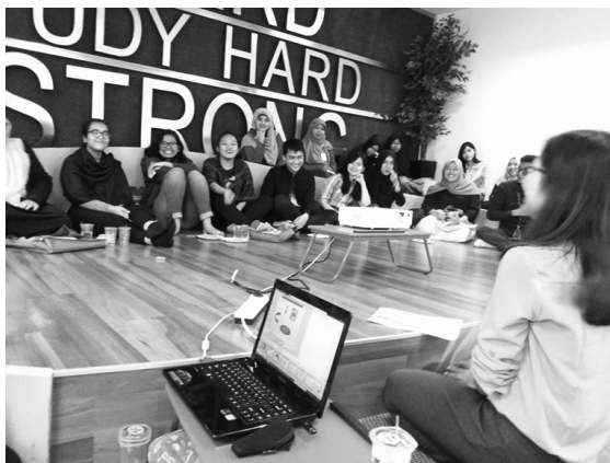
Gambar 4: Kegiatan Open discussion - berbagi pengetahuan di Open Library

Telkom University Open Library tidak hanya memberikan perhatian dan menyediakan akses secara online kepada masyarakat pengguna, untuk kegiatan pengembangan pengetahuan dan komunitas Tel-U Open Library memfasilitasi area dan saran yang dapat digunakan oleh masyarakat umum. Open Discussion adalah program pengembangan pengetahuan dan kegiatan komunitas yang diselenggarakan